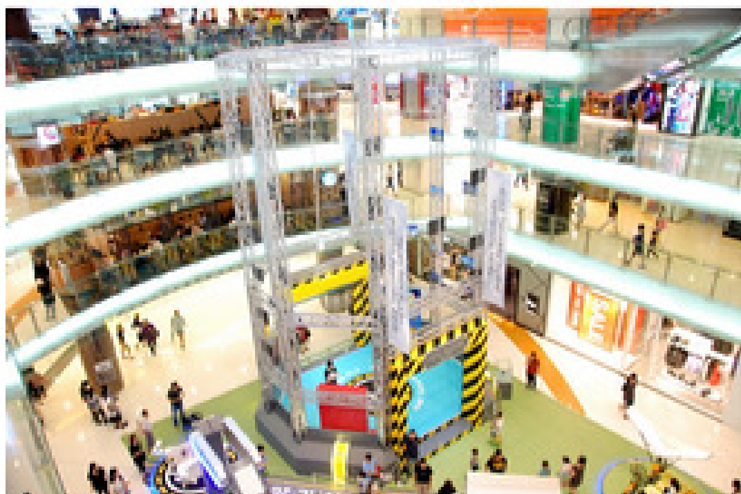
在荃灣廣場內搭建逾 11 米高的室內航拍競技場。