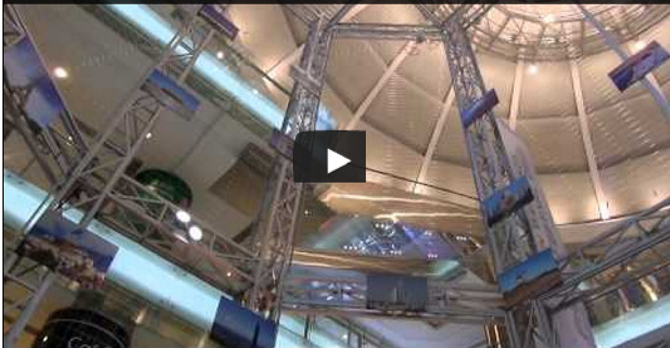
ezone.hk @ 荃灣廣場 Photo Festival 室內航拍競技場示範

即 click 下圖，專業導師 Benny 示範如何在逾 11 米室內航拍競技場高飛而不失霸氣！Benny 話航拍無人機即使有定位功能，但在高度逾 3 米以上就開始無效，你留意 Benny 隻機飛到上 11 米仲好狠堅定，機身無乜失衡飄搖，絕堅！有興趣報名嘅 ezone.hk 粉絲落足眼力，在這高籠裡貼滿 30 張圖片，你能夠在幾分鐘內駕駛航拍無人機把它們一一拍照集郵嗎？